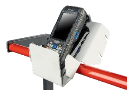
Porte-douche 882 006 149