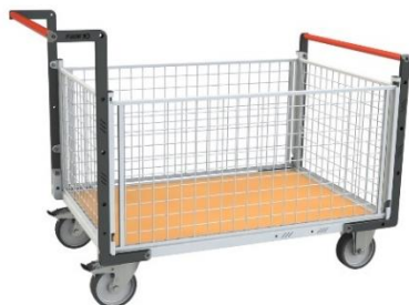
Version 500 kg Habillage grillagé