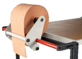
Dévidoir 882 006 152 Pour rouleaux Ø 300 mm maxi.