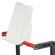
Porte-documents format portrait A4 882 006 150