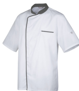
Blanc - Anthracite