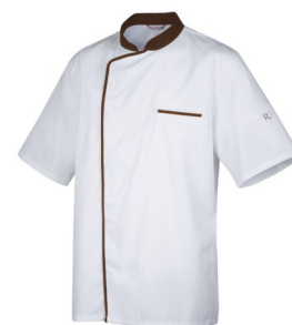
Blanc - Moka