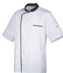
Blanc - Noir